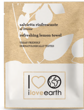
Salvietta rinfrescante al limone Bustina in carta M0023362 - PRO39536

Linea leggera, interamente in flowpack in carta. L'utilizzo della carta è una scelta responsabile che contribuisce a ridurre i rifiuti in plastica monouso.