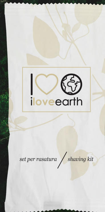
Set barba Flow-pack in carta 100% riciclata M0023366 - PRO39540