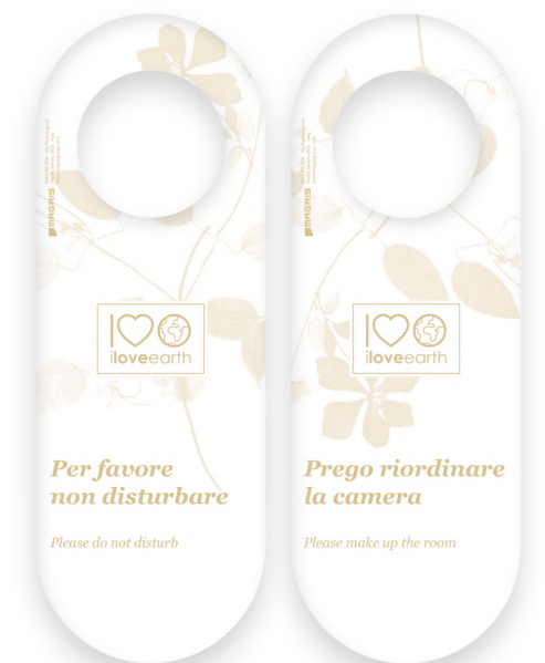
Cartelli non disturbare M0023438 - PRO39547