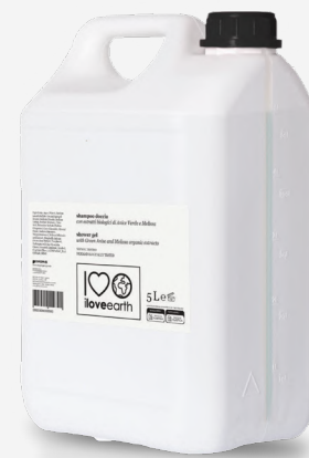
Shampoo doccia con estratti biologici di Anice Verde e Melissa