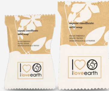
Sapone vegetale derivato da oli naturali

M0023360 - PRO39534 - 20 g M0023359 - PRO39533 - 8 g