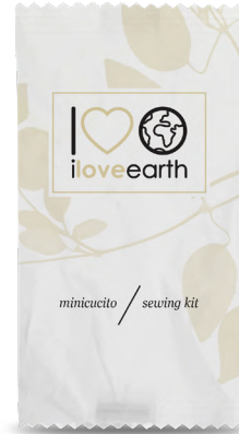
Set minicucito Flow-pack in carta 100% riciclata M0023368 - PRO39542