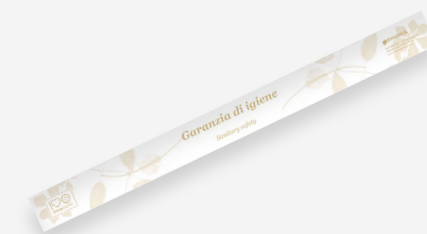
Striscia garanzia WC