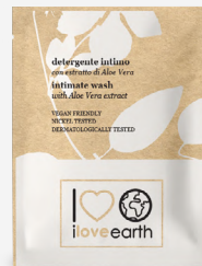
Detergente intimo con estratto di Aloe Vera

M0023354 - PRO39529 - 12 ml M0023353 - PRO39528 - 7 ml