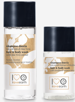
Shampoo doccia con estratto di Aloe Vera

M0023356 - PRO39531 - 30 ml M0023355 - PRO39530 - 20 ml