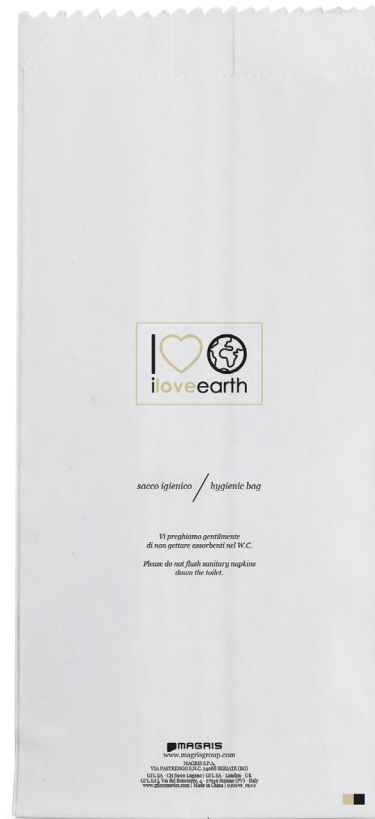
Sacchetto igienico In carta bianca M0023364 - PRO39538