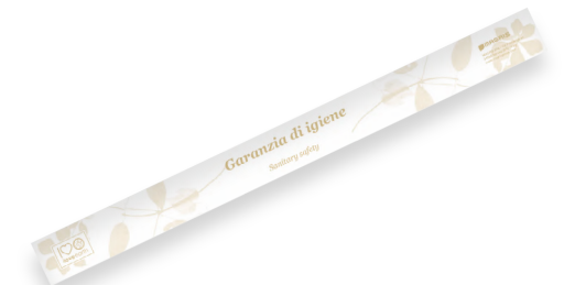
Striscia garanzia WC M0023439 - PRO39548