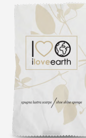
Spugna lustra scarpe