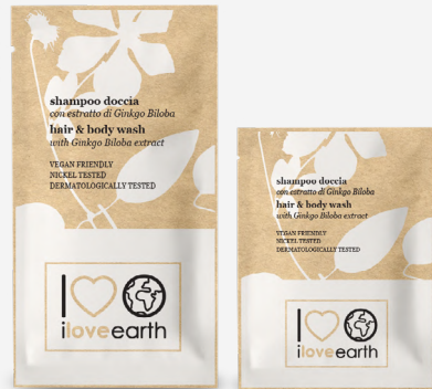
Shampoo doccia con estratto di Ginkgo Biloba

M0023354 - PRO39529 - 12 ml M0023353 - PRO39528 - 7 ml