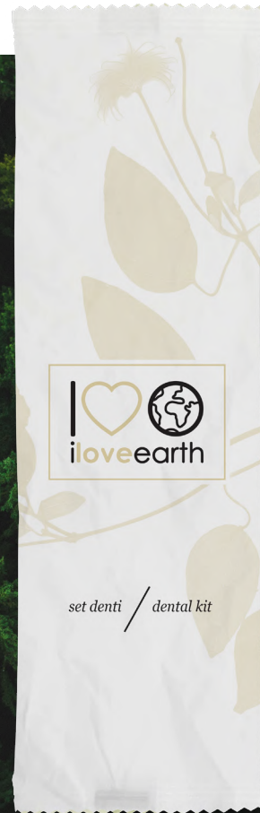
Set denti Flow-pack in carta 100% riciclata M0023365 - PRO39539