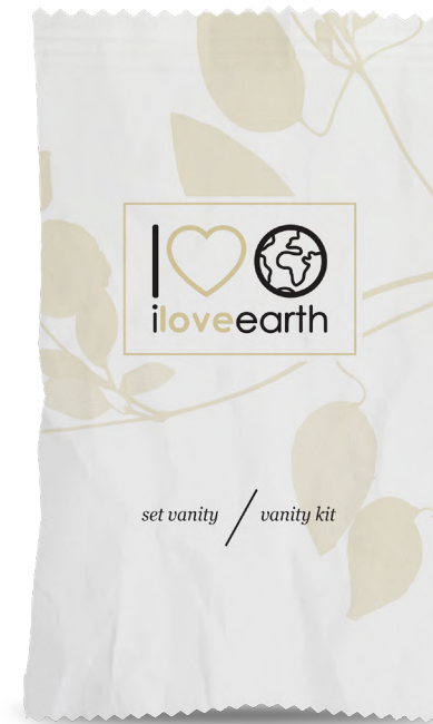
Set vanity Flow-pack in carta 100% riciclata M0023363 - PRO39537