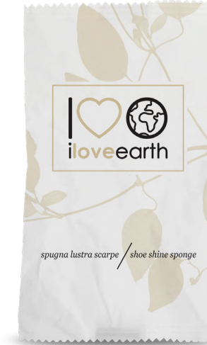
Spugna lustra scarpe Flow-pack in carta 100% riciclata M0023370 - PRO39544