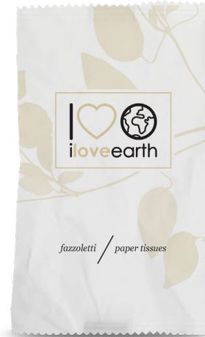
Set fazzoletti Flow-pack in carta 100% riciclata M0023369 - PRO39543