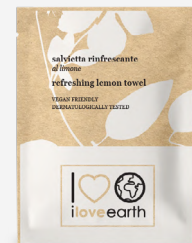
Salvietta rinfrescante al limone