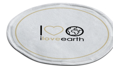
Sottobicchiere M0023372 - PRO39546