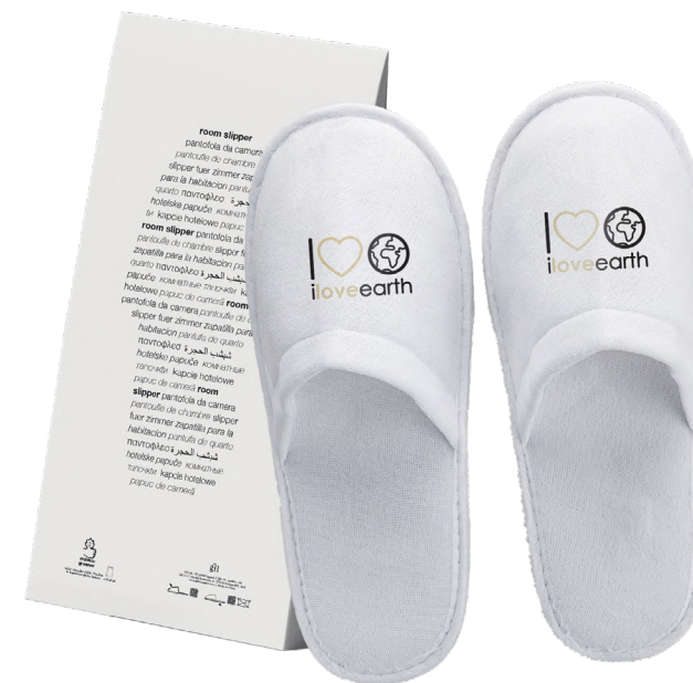
Pantofola chiusa in poliestere M0023371 - PRO39545