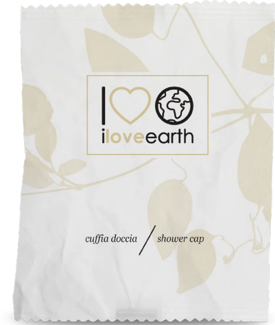
Cuffia doccia Flow-pack in carta 100% riciclata M0023367 - PRO39541