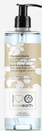
Shampoo doccia con estratti biologici di Anice Verde e Melissa Bottiglia in plastica 100% riciclata