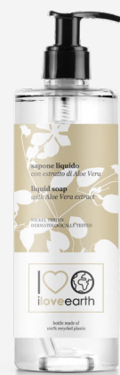
Sapone liquido con estratto di Aloe Vera Bottiglia in plastica 100% riciclata