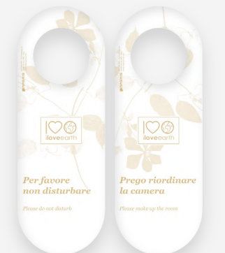
Cartelli non disturbare