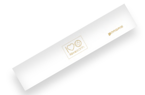
Stuzzicadenti M0057427 - PRO39555